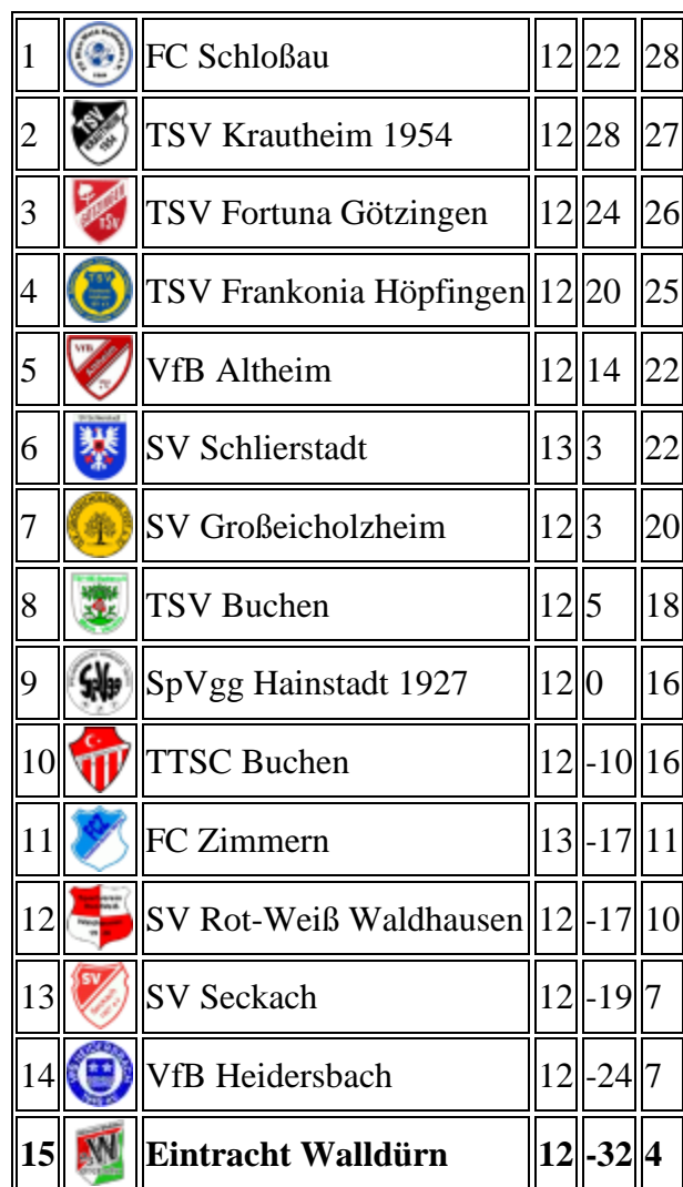
Tabelle Kreisklasse B Buchen